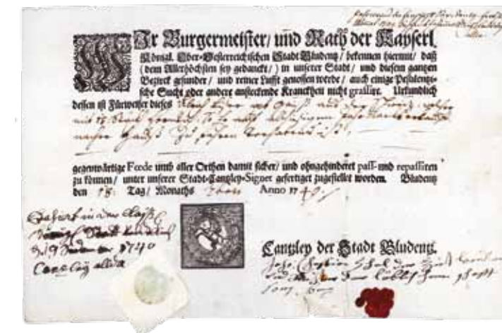
Bludnzer Gesundheitspass vom 18. September 1749 für Ulrich Biser aus Gais – Belegstück für den einst regen Viehhandel mit Vorarlberg

Zusammen mit ab 1513 entstandenen Objekten und Dokumenten aus Archiven, Bibliotheken und Museen bilden private Erinnerungsstücke den Rohstoff für die «Appenzeller Geschichte in Zeitzeugnissen».