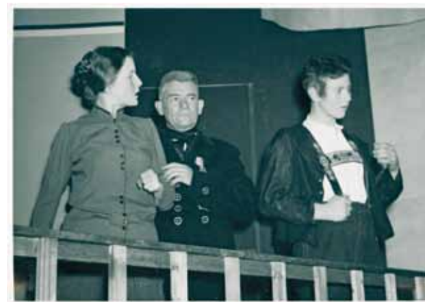
Verhörscene aus der Mundart-Tragödie «Anna Koch» von Alfred Fischli – Uraufführung der Theatergesellschaft Appenzell am 5. November 1959

Daraus ergeben sich Bezüge zur Schweizer Geschichte und zur weltweiten Vernetzung des Appenzellerlandes. Altbekanntes wird weitergetragen und Unbekanntes ist zu entdecken.