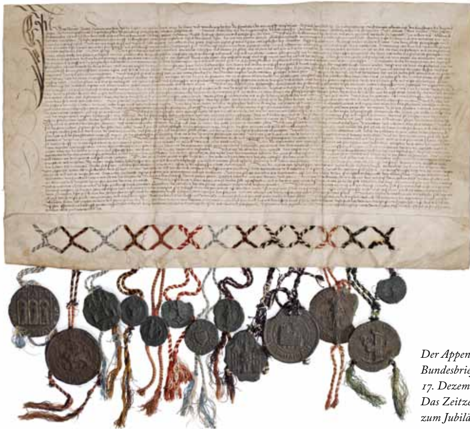
Der Appenzeller Bundesbrief vom 17. Dezember 1513 – Das Zeitzeugnis zum Jubiläumsjahr

Das historische Ereignis wird gemeinsam gefeiert. Die Gedenkfeierlichkeiten, das Musiktheater, die Kulturbühne und das Geschichtsprojekt begleiten durchs Jubiläumsjahr. Die Webseite www.arai500.ch informiert über alles Wissenswerte.